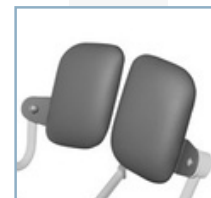
Μέρη καθίσματος περιστρέφεται προς τα πλάγια για να διευκολύνει τον τελικό χρήστη να πάρει τη θέση του