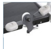
Μοχλός ποδιού επιτρέπει την εύκολη ρύθμιση του ανοίγματος των ποδιών της βάσης, η οποία σε συνδυασμό με το χαμηλό υποπόδιο επιτρέπει την εύκολη προσέγγιση αναπηρικών αμαξιδίων, κρεβατιών κ.λπ.