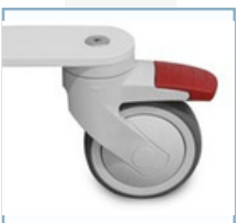
Οπίσθιοι τροχοί με κλειδαριά αποφυγή ακούσιας μετακίνησης, π.χ. όταν ο τελικός χρήστης κάθεται