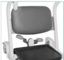
Παροχή στήριξης κατά την ανύψωση σε ημι-ορθή θέση, καθώς και στα πόδια του ασθενούς κατά τη διάρκεια της μεταφοράς